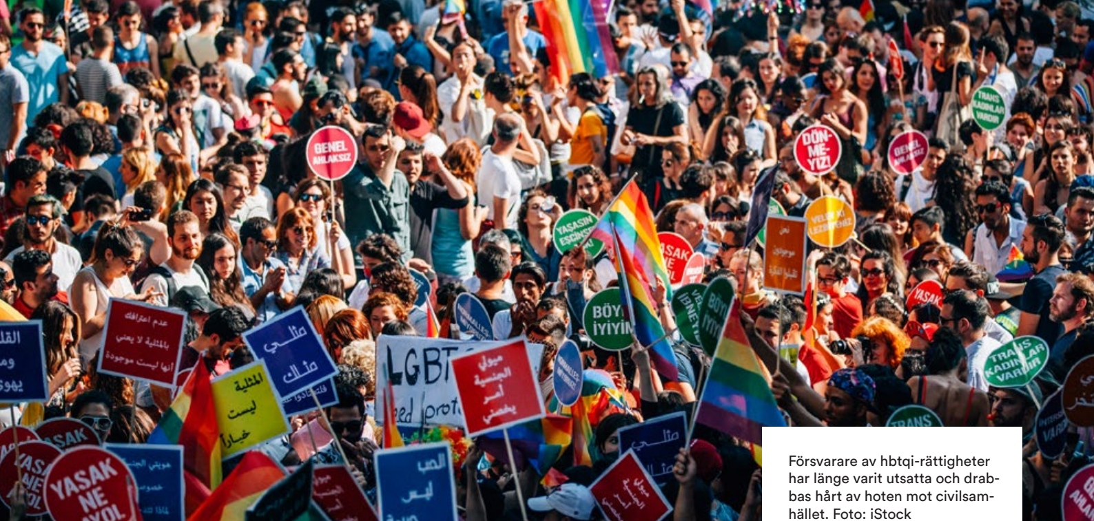
Försvarare av hbtqi-rättigheter har länge varit utsatta och drabbas hårt av hoten mot civilsamhället.