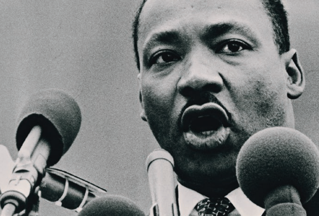
Martin Luther Kings och afroamerikanska kyrkors arbete för svartas rättigheter i USA är ett exempel på civilsamhällets avgörande roll för samhällsförändring.