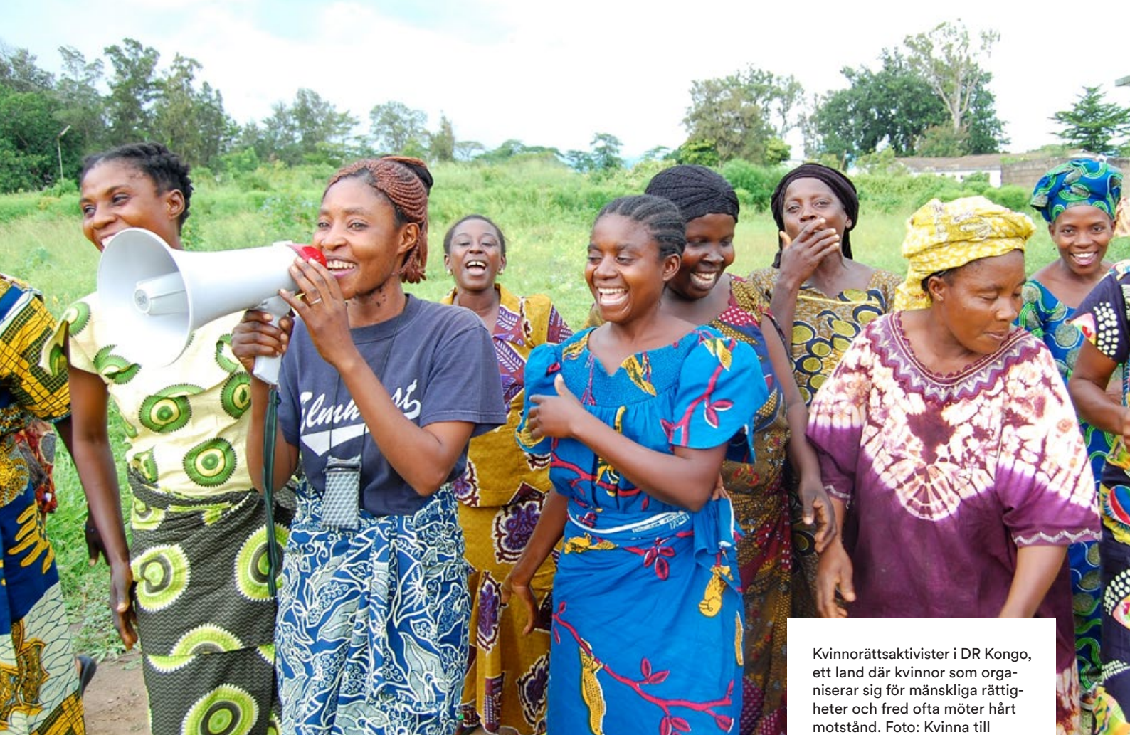
Kvinnorättsaktivister i DR Kongo, ett land där kvinnor som organiserar sig för mänskliga rättigheter och fred ofta möter hårt motstånd.