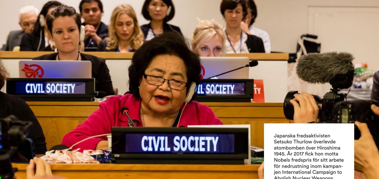
Japanska fredsaktivisten Setsuko Thurlow överlevde atombomben över Hiroshima 1945. År 2017 fick hon motta Nobels fredspris för sitt arbete för nedrustning inom kampanjen International Campaign to Abolish Nuclear Weapons.